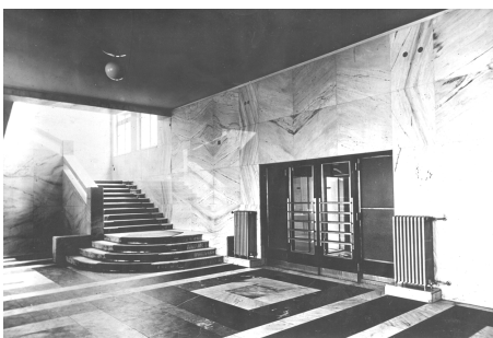
Vstupní hala rozhlasové budovy v roce 1934