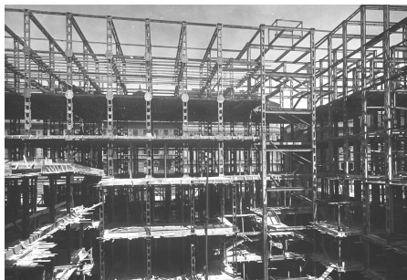
Stavba nové rozhlasové budovy v roce 1930

zdroj: JEŠUTOVÁ, E.: OD MIKROFONU K POSLUCHAČŮM. Český rozhlas, Praha 2003