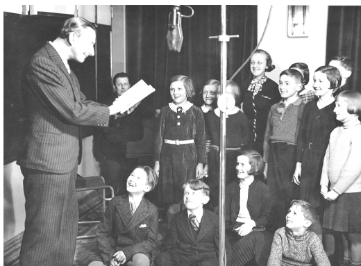
Vlasta Burian v dětské besídce roku 1935

zdroj: JEŠUTOVÁ, E.: OD MIKROFONU K POSLUCHAČŮM. Český rozhlas, Praha 2003