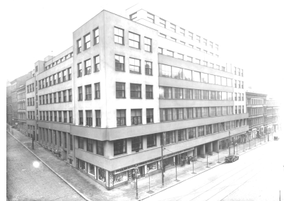
Budova rozhlasu v roce 1933 na dnešní Vinohradské 12